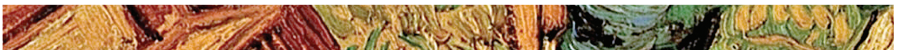
Vincent van Gogh Il buon Samaritano (1890), particolare, olio su tela. Kröller Müller Museum di Otterlo (Olanda).